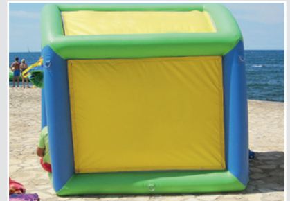
Пример: надувные изделия