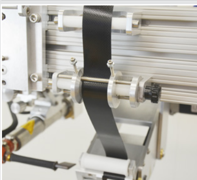
Система подачи ленты (TDS)