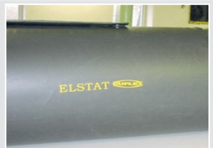
Пример: непрерывные трубы (рукава)