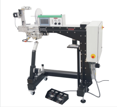
Leister SEAMTEK 36 Базовая версия (включая основание)

Цифровые технологии сварочного автомата SEAMTEK 36 обеспечивают выполнение долговечных, идеальных сварных швов. Его быстро изменяемая, модульная конструкция, а также широкий выбор различных прижимных роликов и диапазонов ширины сварочных сопел гарантируют максимальную гибкость применения. Оригинальная